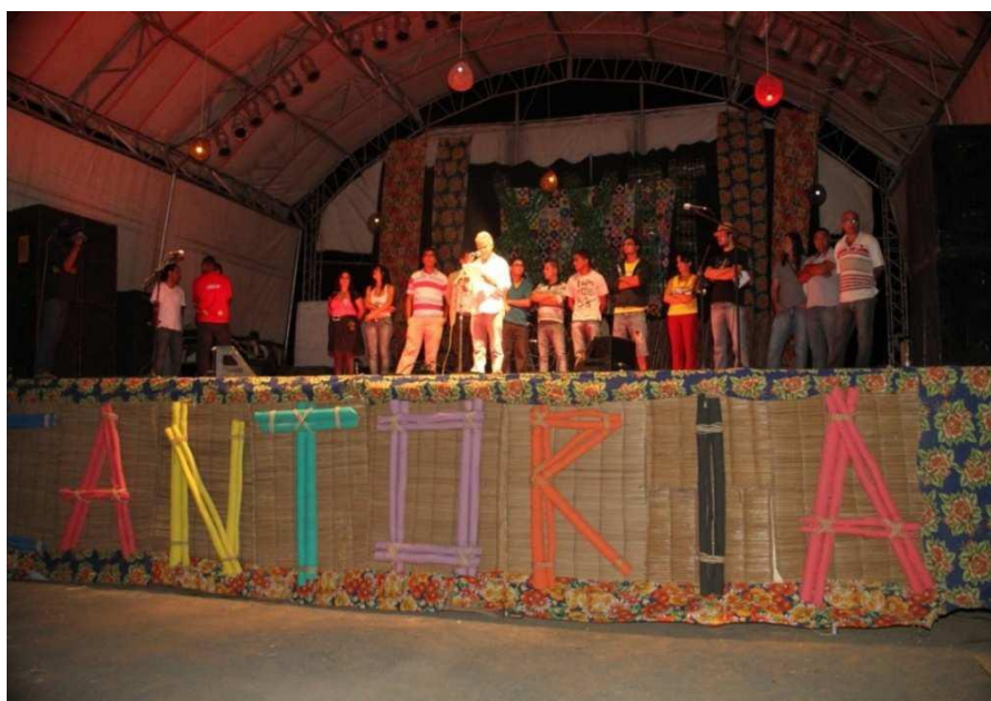
Imagem 1:

Na XXII cantoria a pauta principal foi o meio ambiente e a importância da preservação de seus recursos naturais. Tendo como tema A questão ambiental e a construção de práticas educativas e formativas pela Fundação Culturarte de São Gabriel , a entidade promoveu a coleta seletiva, por meio de lixeiras dispostas na praça, além das faixas com frases voltadas para a conscientização do público. Tudo isso reverberou no palco que foi todo ornamentado com material reciclado.